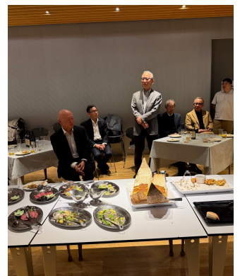
写真⑥：懇親会 参加者スピーチ