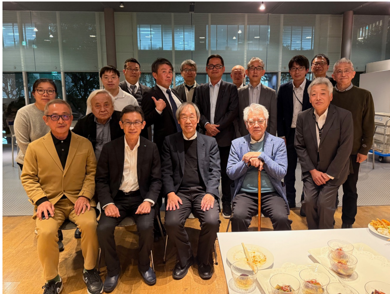
写真④：懇親会参加者 集合写真（2階・カフェテリアにて）