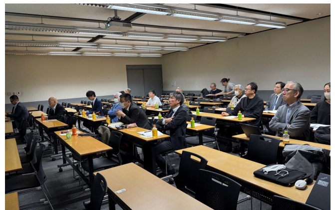
写真③：講演会風景（1階・132教室）