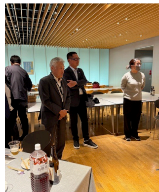
写真⑤：懇親会 参加者スピーチ